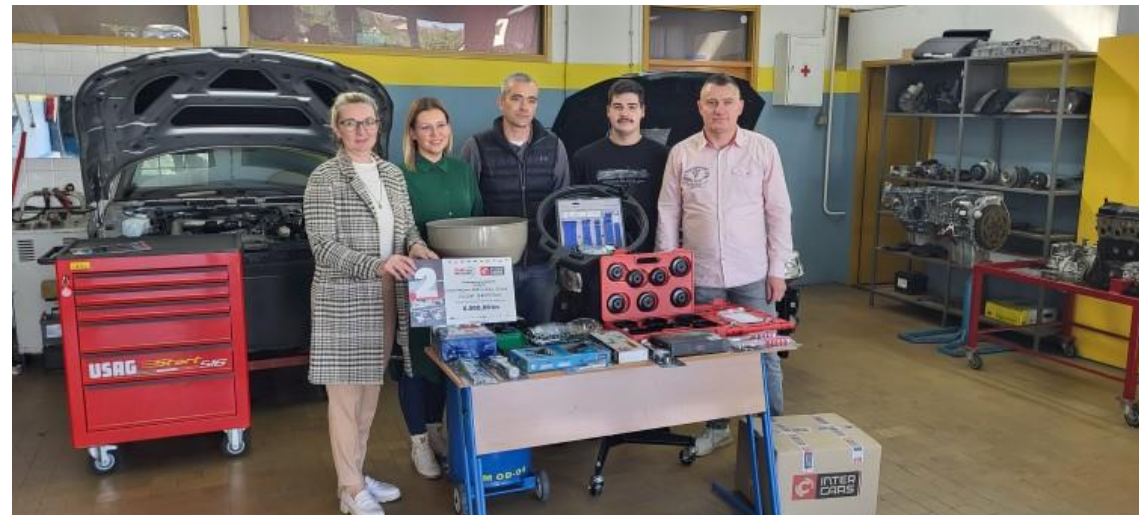
Industrijsko-obrtnička škola Nova Gradiška – 2. mjesto HR