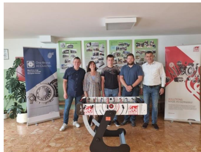
SŠ Konjščina – utješna nagrada za četvrtoplasiranog od dobavljača Febi (stolni nogomet)