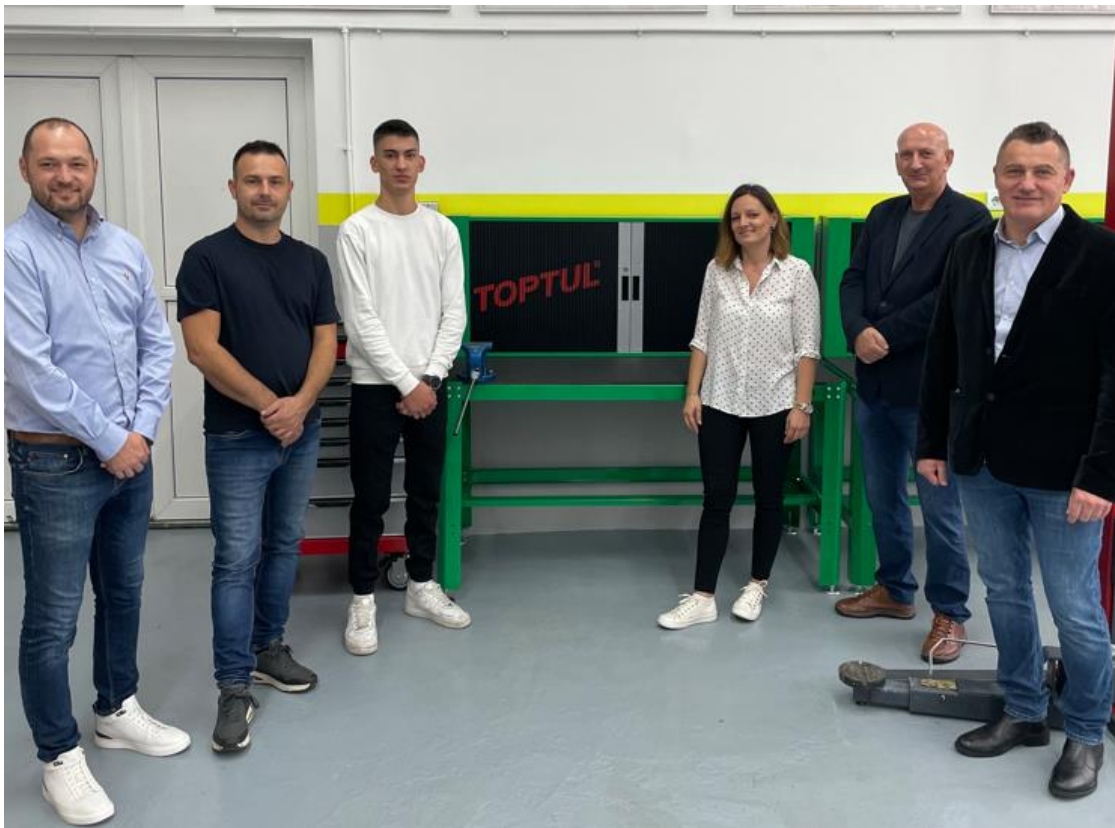
ESOS – 1. i 3. mjesto HR, 2. mjesto internacionalno finale